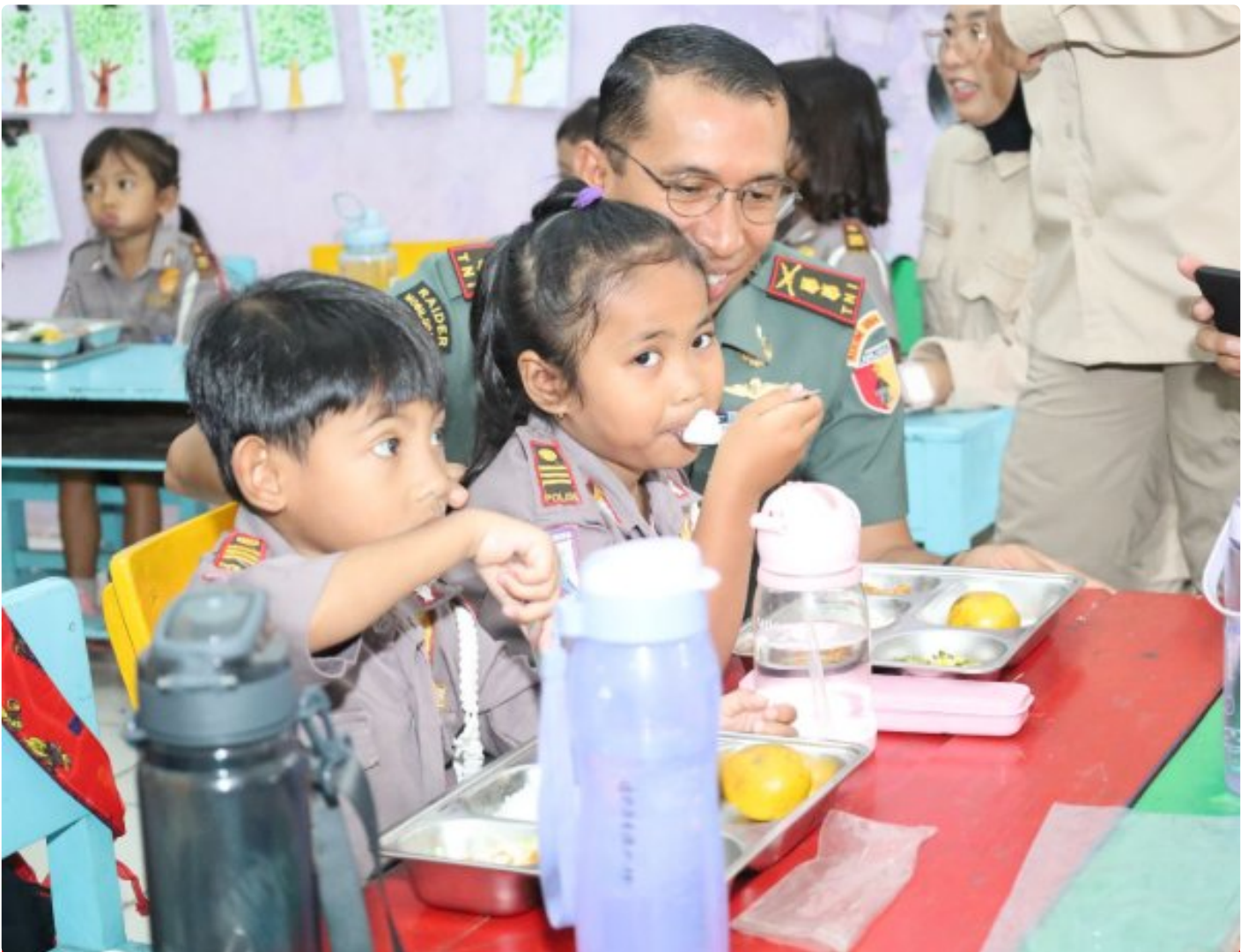
Dandim 0804/Magetan Bersama Forkopimda Dampingi Pemberian Uji Coba Makanan Bergizi Gratis