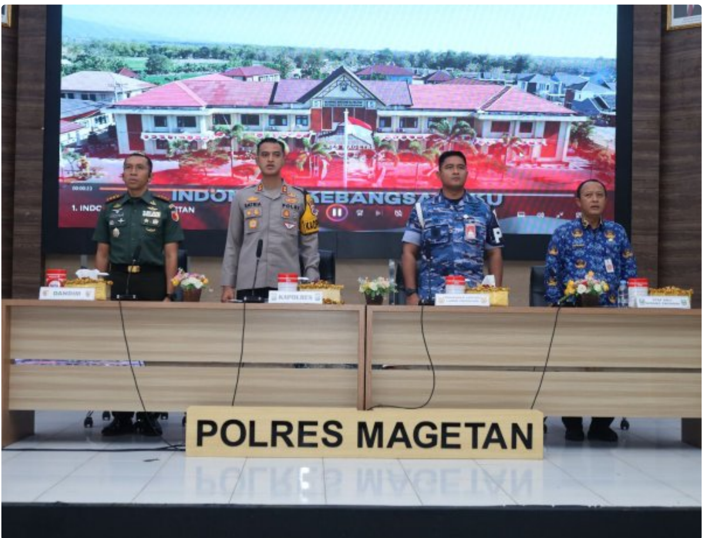
Dandim 0804/Magetan Hadiri Rakor Lintas Sektoral kesiapan operasi lilin 2024

Magetan. – Guna meningkatkan Sinergitas dalam rangka kesiapan operasi lilin 2024 pengamanan Hari Raya Natal 2024 dan Tahun Baru 2025 di wilayah Kabupaten Magetan yang aman dan kondusif.