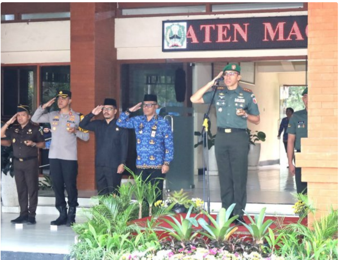
Dandim 0804/Magetan Pimpin Upacara Peringatan Bela Negara Ke-76 Tahun 2024