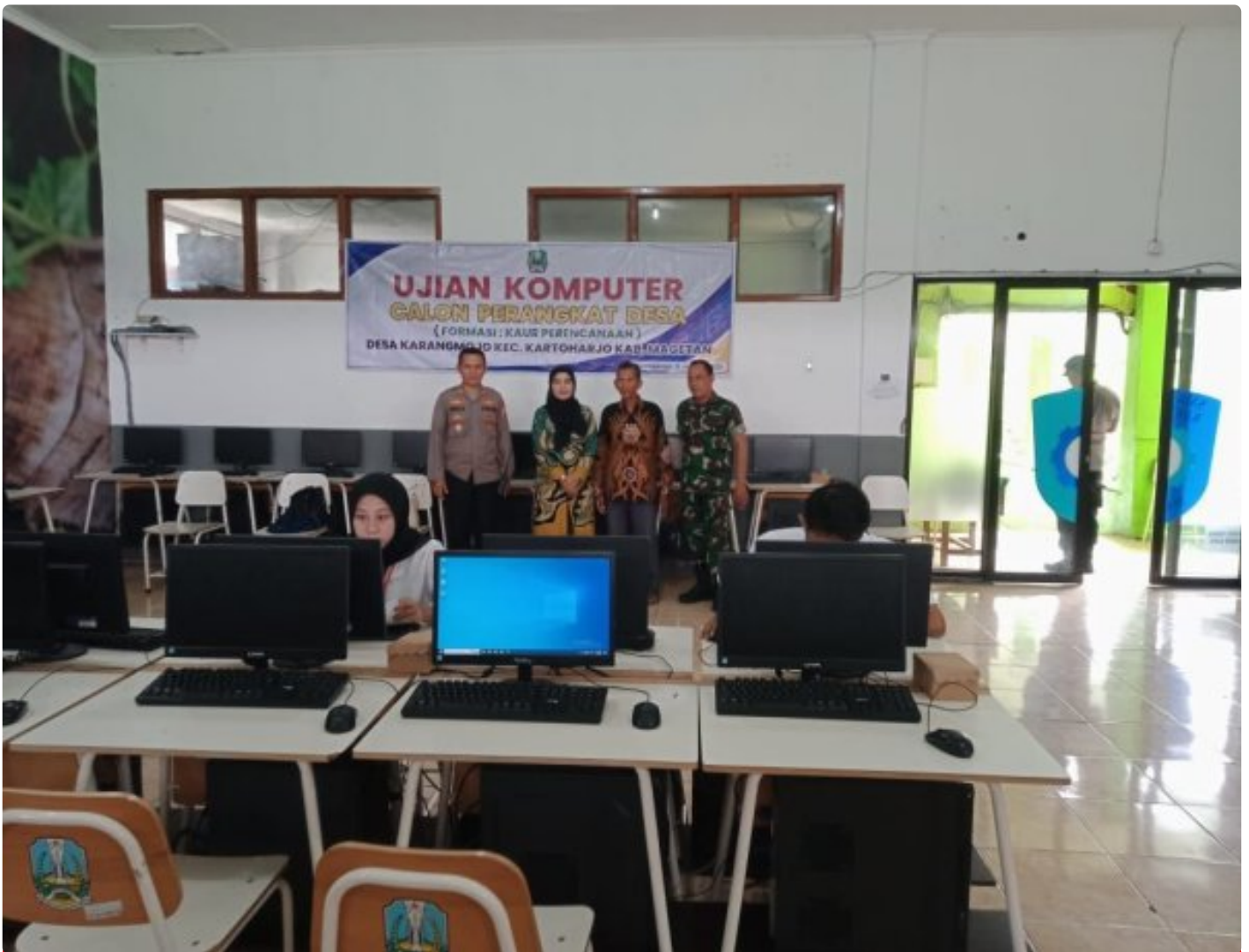
Danramil 0804/08 Barat Hadiri Penjaringan Ujian Praktek Komputer Calon Perangkat Desa Karangmojo

Magetan. – Komandan Koramil (Danramil) Tipe B 0804/08 Barat Kapten Inf