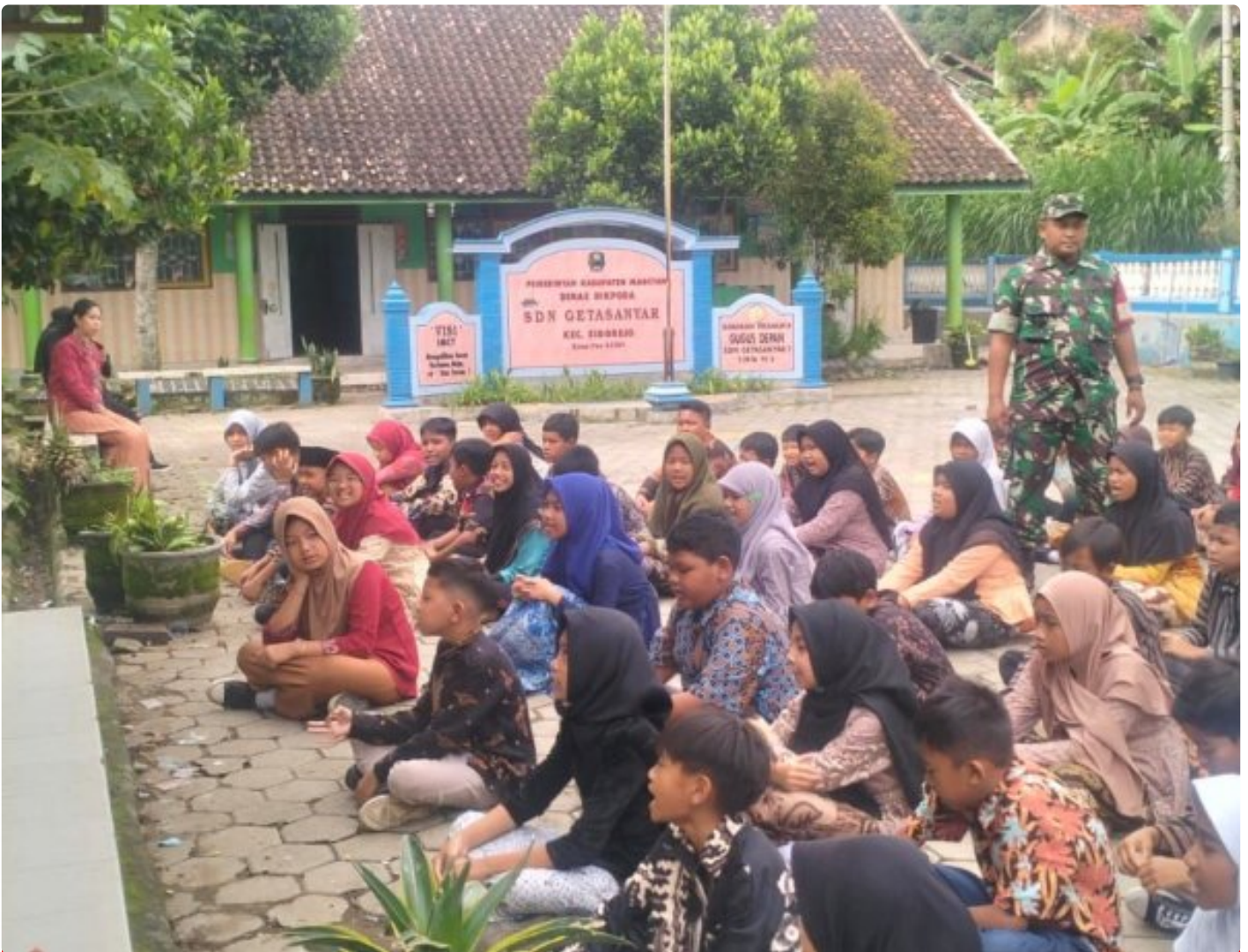
Kedisiplinan Kunci Kesuksesan, Bati Komsos Posramil Sidorejo Melatih PBB dan WASBANG Siswa SDN 1 Getasanyar